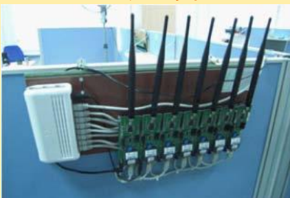
無線センサー網試験設備の一部